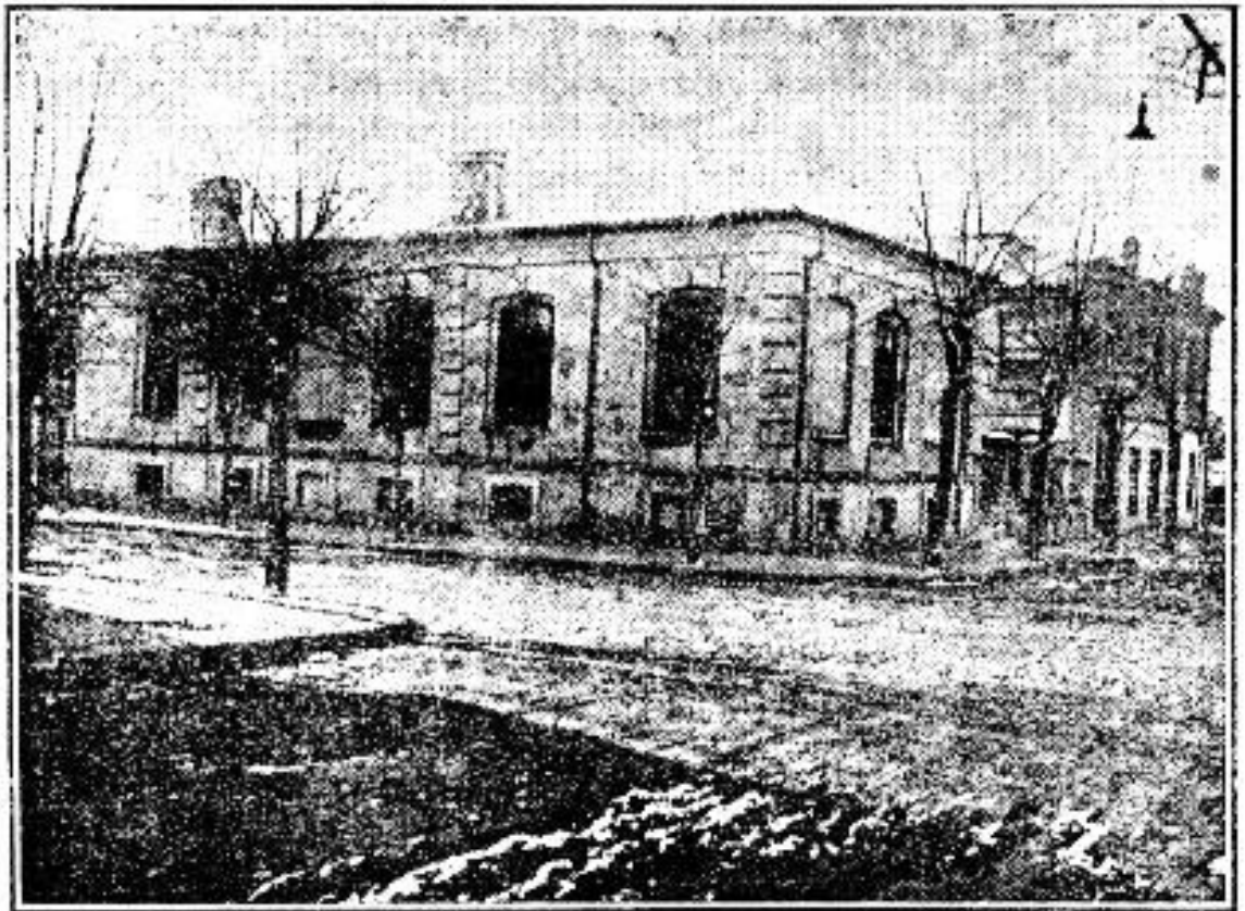
Cel dintâi local al gimnaziului Str. Mihai Viteazul colț cu str. Rahovei și str. general Lahovary. Localul actual al liceului ocupat din 1903 se vede pe coperta anuarului.